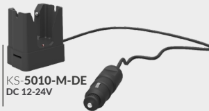
KS 5010-M-DE DC 12-24V